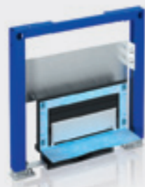
Duofix – Elemento per docce con scarico a parete, modulo base

Impiego: per costruzioni nuove e ricostruzioni, per l'installazione in una parete ad altezza parziale oppure nella variante ad altezza del locale. Per l'inserimento in pareti applicate e pareti divisorie per costruzioni leggere a secco