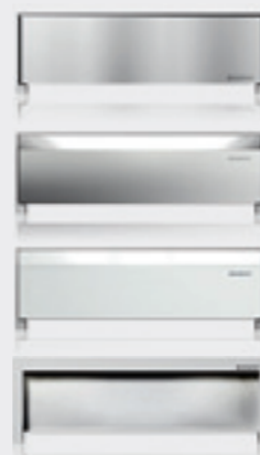
Copertura di design

Rubinetti: libera scelta della posizione e del tipo di rubinetti Impiego: altezza parziale oppure ad altezza del locale in pareti di costruzioni massiccia (muratura)