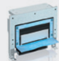
Uniflex – Elemento per docce con scarico a parete, modulo base