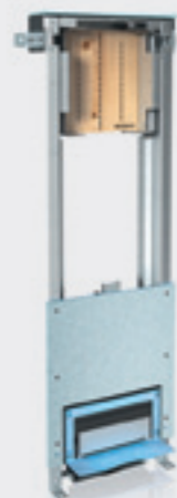
Uniflex – Elemento per docce con scarico a parete per posa nell'angolo, per miscelatore ad incasso UP