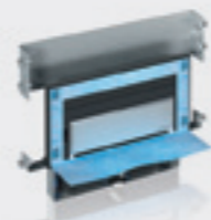
GIS – Elemento con scarico a parete

Rubinetti: libera scelta della posizione e del tipo di rubinetti Impiego: altezza parziale oppure ad altezza del locale in pareti di costruzioni leggere a secco